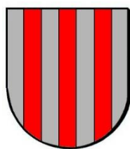
Afb. 1. Het algemeen wapen van de familie Van Berchem (Ranst).

Van de meeste leden van de familie zijn, zoals hiervoor al is vermeld, zegels bewaard gebleven, waaruit blijkt dat het heraldische wapen van de familie Van Berchem drie palen vertoont en wordt beschreven als ‘in zilver drie palen van rood’ (afb. 1). 5