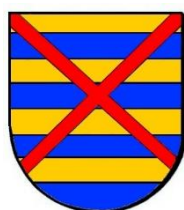
Afb. 1. Het algemeen wapen van de familie Van Beveren.

De heerlijkheid Pumbeke strekt zich uit over de plaatsen St.-Niklaas, Belsele en Waasmunster in Oost-Vlaanderen (B) en is leenroerig aan de heerlijkheid Beveren. Beide geslachten voeren hetzelfde wapen (afb. 1). 5 Dit maakt het aannemelijk dat de familie Van Pumbeke een jongere tak vormt van de Heren van Beveren.